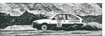
B-IIクラスのウィナー⑨堂地。ウィンターシーズンからダートシーズンへと突入した北海道のダートラシーンだが、やはり4WDが優勢か。⑨堂地は翌週の全道選手権でも優勝した。